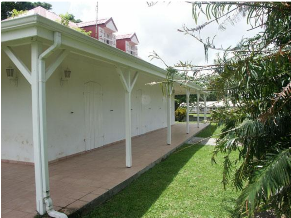
Maison médicale du Centre Hospitalier de Montéran

*Kamo = nouvelles fraîches, anecdotes, informations (Dictionnaire créole-français - Maisonneuve et Larose, Servédit, Editions Jasor).